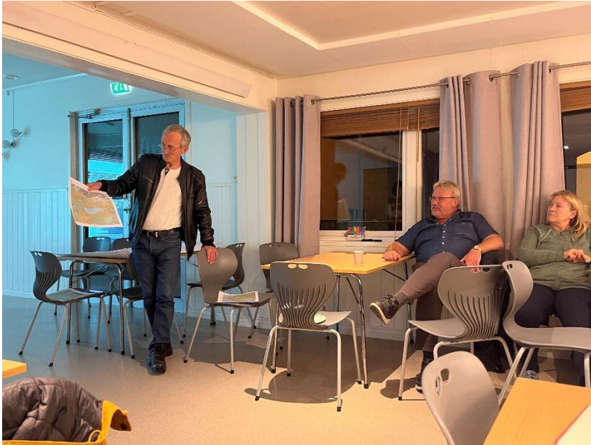
Figur 2: Gruppepresentasjon