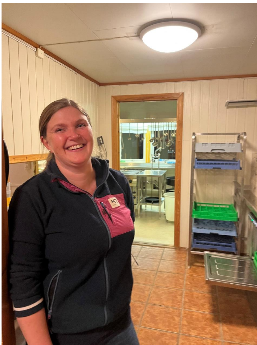
Figur 5: Deltaker i "kjøkken-gruppa", vertskap for møtet på samfunnshuset