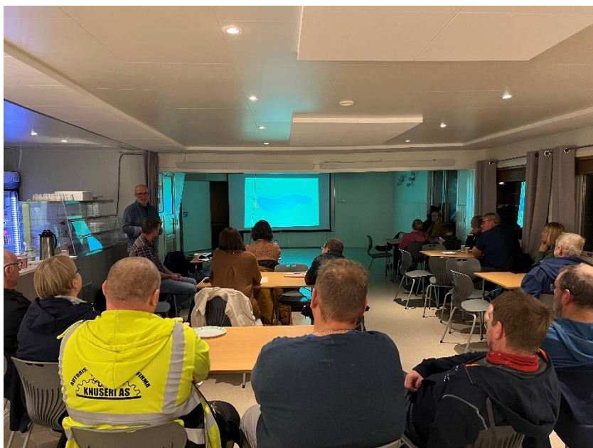
Figur 6: Godt oppmøte på folkemøte

Takk for tilbakemeldinger og konstruktive ideer