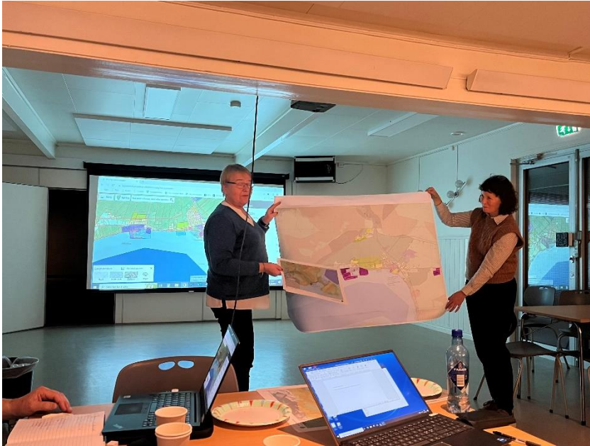
Figur 1: Gruppepresentasjon