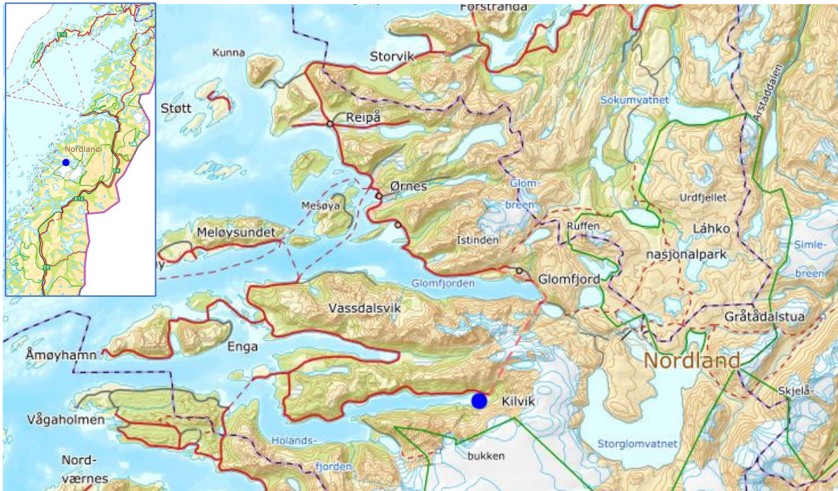
Figur 1. Meløy kommune med lokalisering av Kilvik.

Meløy kommune har nylig vedtatt en detaljreguleringsplan for Kilvik næringsområde og utlyser med dette ledige næringsarealer for utleie.