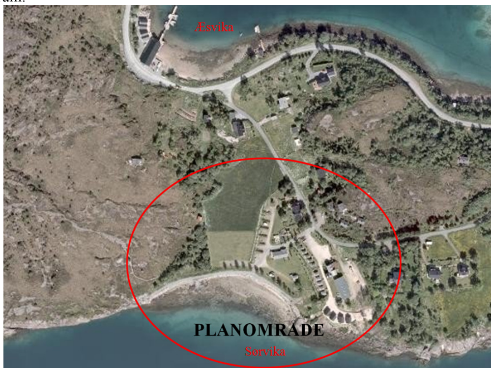
Oversikt som viser planområdets beliggenhet

Planområdet ligger på sørsiden av Forøy, mellom Æsvika og Sørvika, ca. 2,2 km fra Halså sentrum.